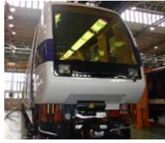
Le syndicat au service des traminots